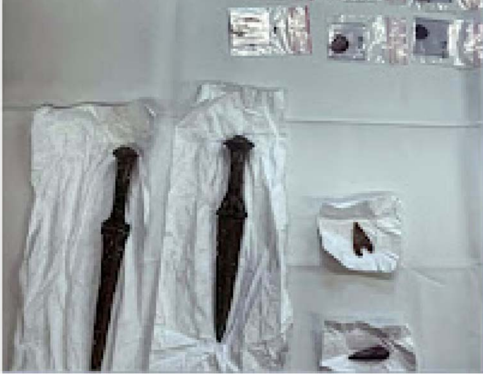
ستويسرا تعيد للعراق خنجرين ورأسي رمح عمرها 3 آلاف عام